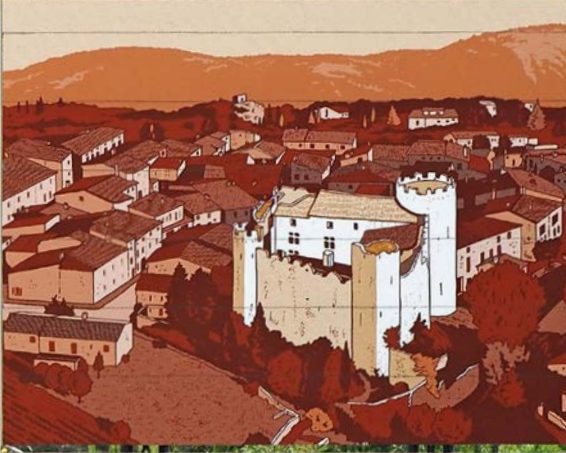
CHÂTEAU DE VILLEROUGE TNÈS

«Auf den Spuren der Katharer». Eine Töffreise, die mehr hinterlässt als nur Stollen-Abdrücke: Ein Pistenabenteurer zu den Kapiteln einer Tragödie, die in Okzitanien als leiser christlicher Gegenentwurf begann – asketisch, gewaltlos und auch mit Frauen als Priesterinnen.