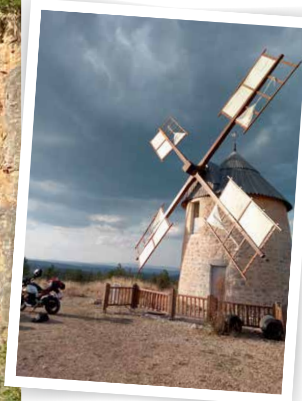
Le Moulin de la Borie werd helemaal opnieuw opgebouwd, nog altijd wordt er meel geproduceerd.

recreatiegebied. Leuke bijvangst, het hoofddoel van het meer is namelijk om de waterstand van de Loire ter plekke op peil te houden, zodat een constante koeling van de nabijgelegen kernreactor gewaarborgd is. Tot m'n grote vreugde maken we hier een kort uitstapje met elektrische scooters, dat deels over zeer smalle paden voert, met aan de ene kant kleurrijke bramenstruiken en aan de andere een steile afgrond. Omdat we met de motor zijn en de gids er daarom van uitgaat dat we ons op twee wielen prima kunnen redden, schotelt hij ons een extra mooie en extra uitdagende toer voor, waarbij we op plekken komen waar we wandelend of met de motor nooit zouden komen. Een fantastische expeditie, maar we zijn hier natuurlijk vooral om te motorrijden.