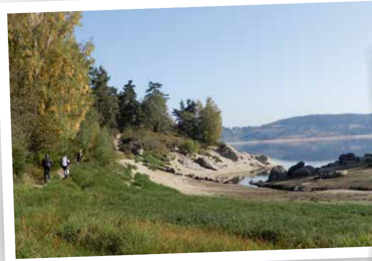
Het Lac de Naussac stuwmeer is een populair recreatiegebied, maar dient voornamelijk om de waterstand van de Loire op peil te houden (boven). Rechts bovenop de bescheiden Col du Gerbier de Jonc.